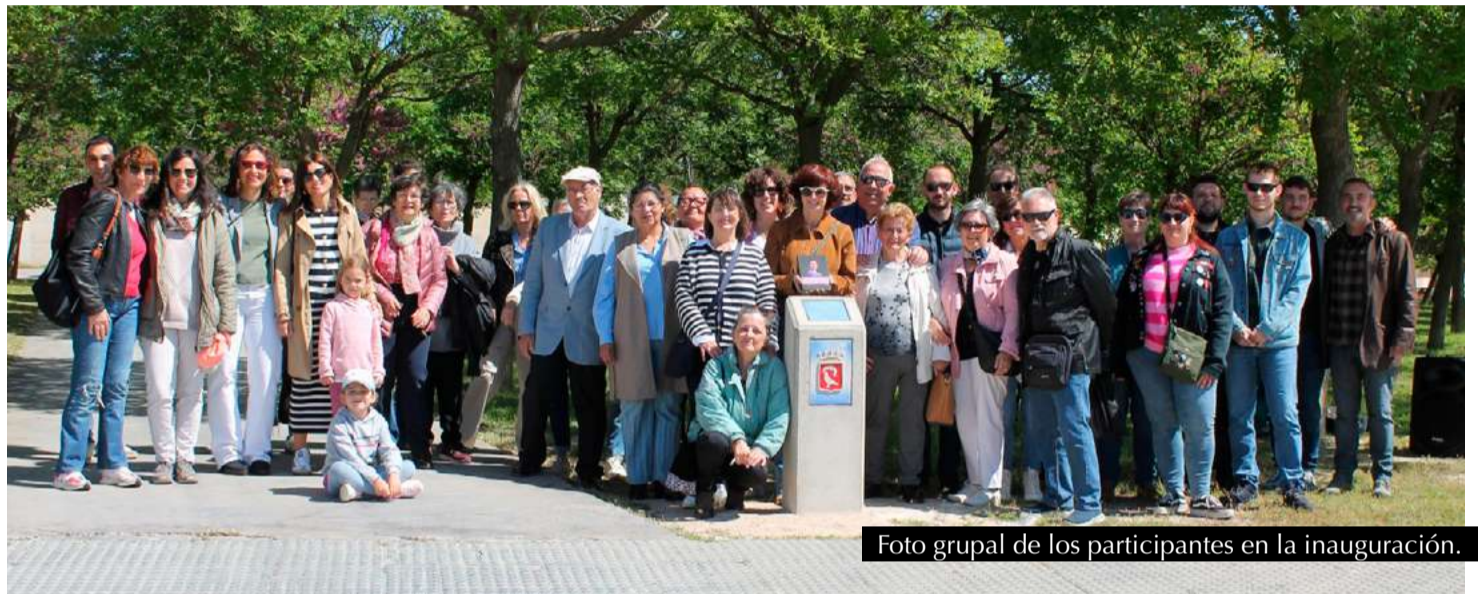
Foto grupal de los participantes en la inauguración.