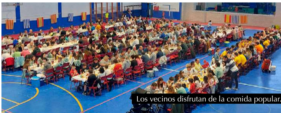
Los vecinos disfrutan de la comida popular.

La jornada terminó con risas y fotos para el recuerdo, dejando claro que, un año más, San Mateo sabe cómo celebrar su tierra y mirar al futuro con unidad y esperanza.