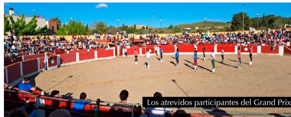
Los atrevidos participantes del Grand Prix.