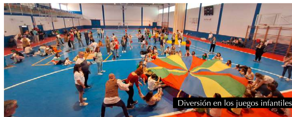
Diversión en los juegos infantiles.