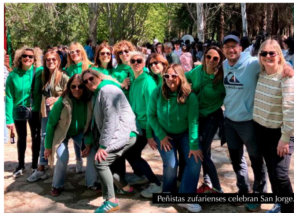
Peñistas zufarienses celebran San Jorge.

para los asistentes, parque infantil y una suelta de vaquillas de la Ganaderías Hnos. Giménez Mora que puso el broche a una jornada festiva de gran ambiente local.