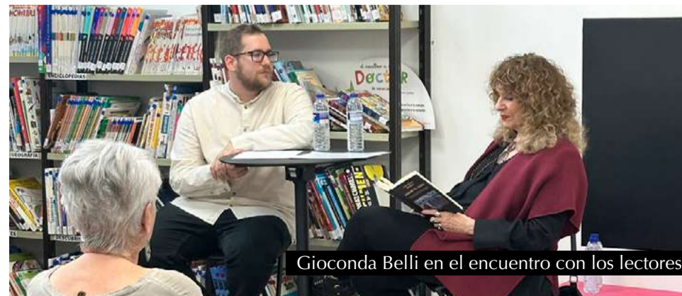
Gioconda Belli en el encuentro con los lectores.

La velada fue, en definitiva, un homenaje al poder de la palabra y al valor de la cultura como herramienta de encuentro y conciencia. La presencia de Gioconda Belli en San Mateo de Gállego no solo fue un hito para el municipio, sino también "un testimonio de cómo la literatura puede abrir ventanas al mundo, tender puentes y tocar el alma de quienes la escuchan", en palabras del concejal de Cultura, Rubén Martínez.