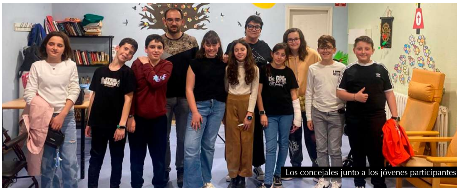
Los concejales junto a los jóvenes participantes.

Como recuerdo especial de este día, el Consejo de la Infancia obsequió a cada residente con un tulipán, acompañado del nombre del Consejo y del niño/a que entregaba la flor, como símbolo del vínculo entre generaciones y del cariño compartido. Este primer encuentro ha dejado huella en todos los participantes, consolidándose como una preciosa iniciativa que promete repetirse en el futuro.