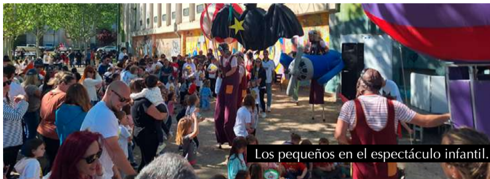
Los pequeños en el espectáculo infantil.

La celebración transcurrió en un ambiente festivo y seguro, gracias a la colaboración de los voluntarios de Protección Civil, la Comisión de Fiestas y la Policía Local. El buen tiempo acompañó durante toda la jornada, permitiendo disfrutar al máximo de este día tan especial para Villanueva.