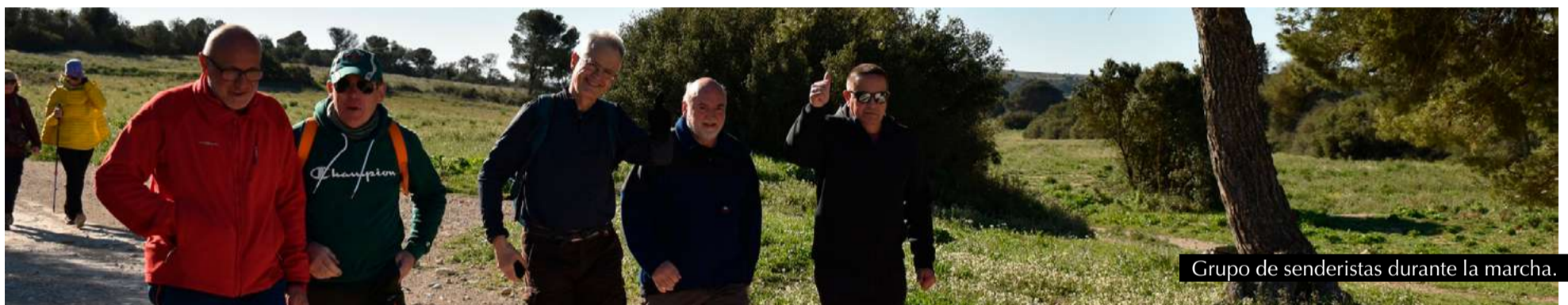
Grupo de senderistas durante la marcha.