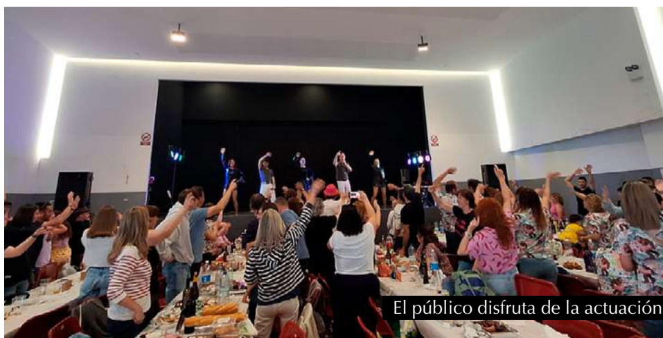
El público disfruta de la actuación.

Como es habitual en San Mateo, la alegría contagiosa que aporta la infancia ha llenado las calles, recordándonos que las fiestas aquí siempre se viven con especial ilusión y vitalidad. La edición de este año reafirma que las Fiestas de Primavera son un momento de encuentro, tradición y comunidad que siguen creciendo gracias al esfuerzo conjunto de todo el pueblo.