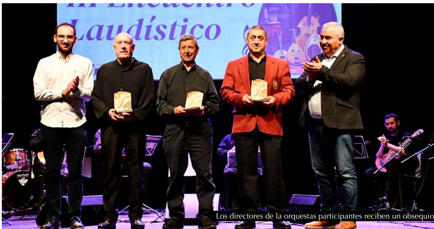
Los directores de las orquestas participantes reciben un obsequio.

El 22 de marzo, Zuera acogió el III Encuentro Laudístico Villa de Zuera en el Teatro Reina Sofía. El encuentro contó con la participación de la Rondalla del Bajo Gállego, Agrupación Laudística de Alhama de Aragón y la Orquesta Laudística Sujayra (Zuera).