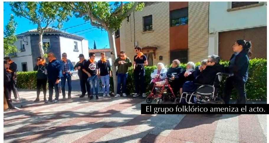
El grupo folklórico ameniza el acto.

más de una decena de paradas en las que los vecinos pudieron disfrutar de jotas personalizadas, creando momentos entrañables y llenos de emoción. Fue, sin duda, una tarde especial para rendir homenaje a nuestros mayores y mantener viva una de nuestras tradiciones más queridas.