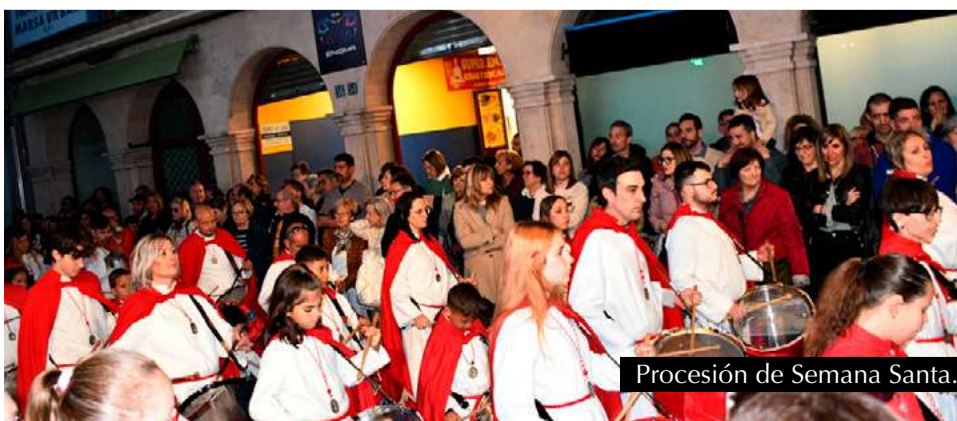
Procesión de Semana Santa.

La jornada concluyó con un emotivo toque conjunto de tambores y bombos en la plaza y, seguidamente, el recorrido continuó por las calles de la localidad hasta el Pabellón Multiusos, donde concluyó el acto.