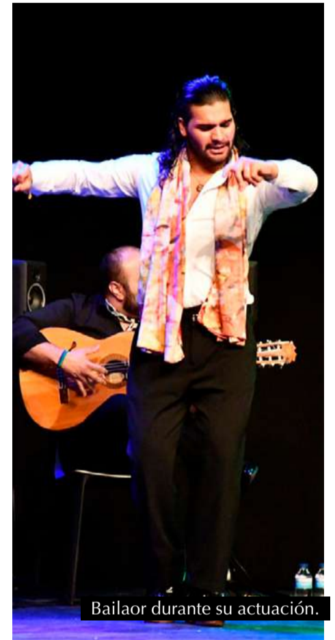
Bailaor durante su actuación.

del Ayuntamiento en la organización y celebración de esta jornada tan significativa. Subrayaron la importancia de seguir impulsando espacios de encuentro y visibilización de la cultura gitana, especialmente, a través