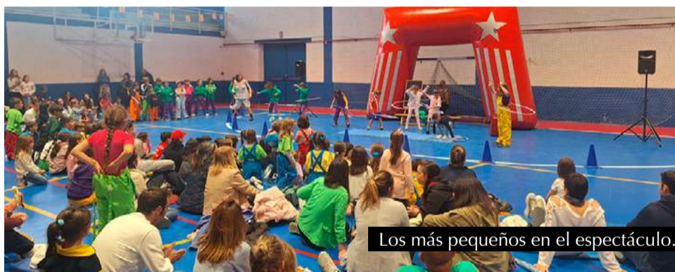
Los más pequeños en el espectáculo.