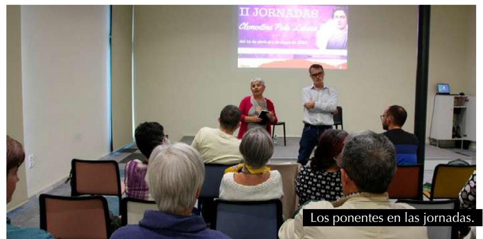
Los ponentes en las jornadas.

Las jornadas debían finalizar el lunes 28 de abril con el espectáculo teatralizado «6 mujeres en 60 minutos», a cargo de M a Carmen Bozal Jurado, sin embargo, debido al apagón nacional, se tuvo que suspender y se emplazará para otra fecha que se anunciará próximamente.