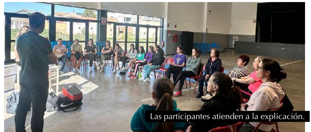
Las participantes atienden a la explicación.

El éxito de la actividad no solo se mide por la asistencia o la lista de espera, sino por la energía con la que las participantes se entregaron al aprendizaje y la sororidad que se generó entre ellas. En palabras de una de las asistentes: "No solo aprendimos cómo defendernos, también salimos más fuertes, más unidas y más conscientes de nuestro valor como mujeres". Desde el consistorio sanmateano, se continuará trabajando para ofrecer espacios formativos y de crecimiento personal que refuercen el tejido social de la localidad y la seguridad de sus ciudadanas.