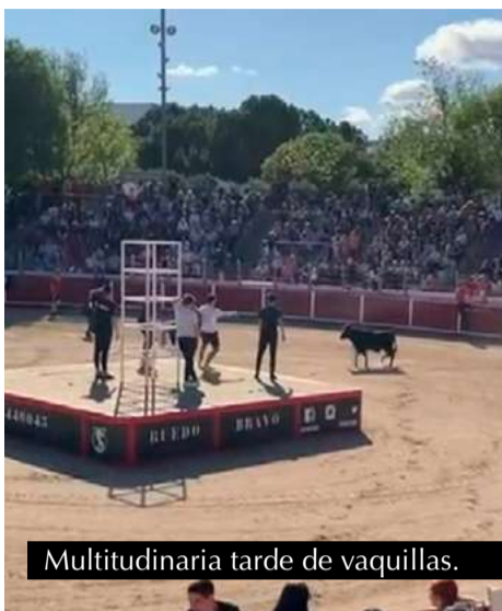
Multitudinaria tarde de vaquillas.