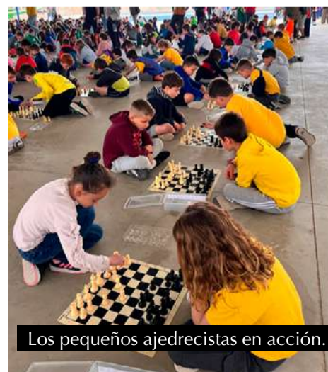
Los pequeños ajedrecistas en acción.

Sin duda, una experiencia enriquecedora que contribuye a fomentar valores como el respeto, la paciencia y el pensamiento crítico entre los más jóvenes.