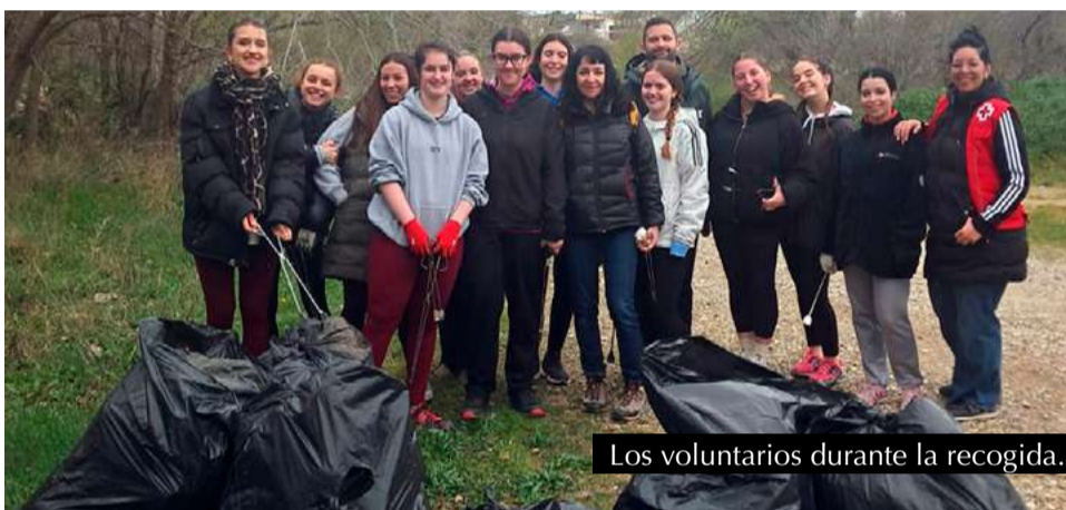
Los voluntarios durante la recogida.

Esta iniciativa forma parte del esfuerzo continuo por concienciar sobre la importancia de cuidar el entorno y reducir el impacto de los residuos en la naturaleza. Cuidemos de nuestro municipio entre todos/as.