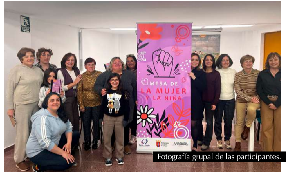
Fotografía grupal de las participantes.

impulsando este espacio con regularidad, dotándolo de recursos y respaldo institucional para que pueda cumplir con su función transformadora. La próxima reunión ya está en marcha, con nuevas propuestas sobre la mesa y la firme convicción de que este órgano será clave para construir un municipio más justo, solidario, igualitario y habitable para todas y todos.