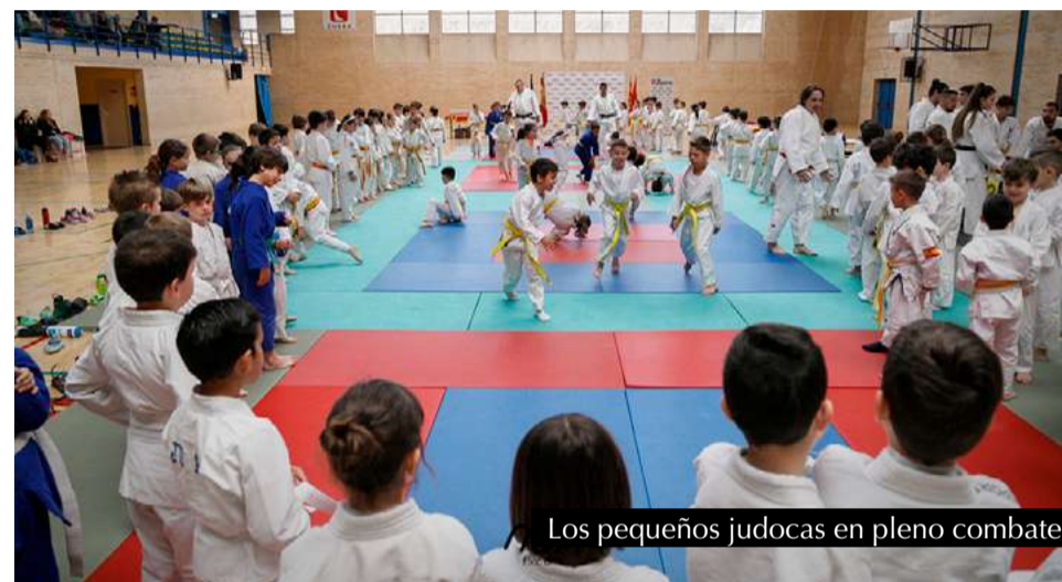
Los pequeños judocas en pleno combate.