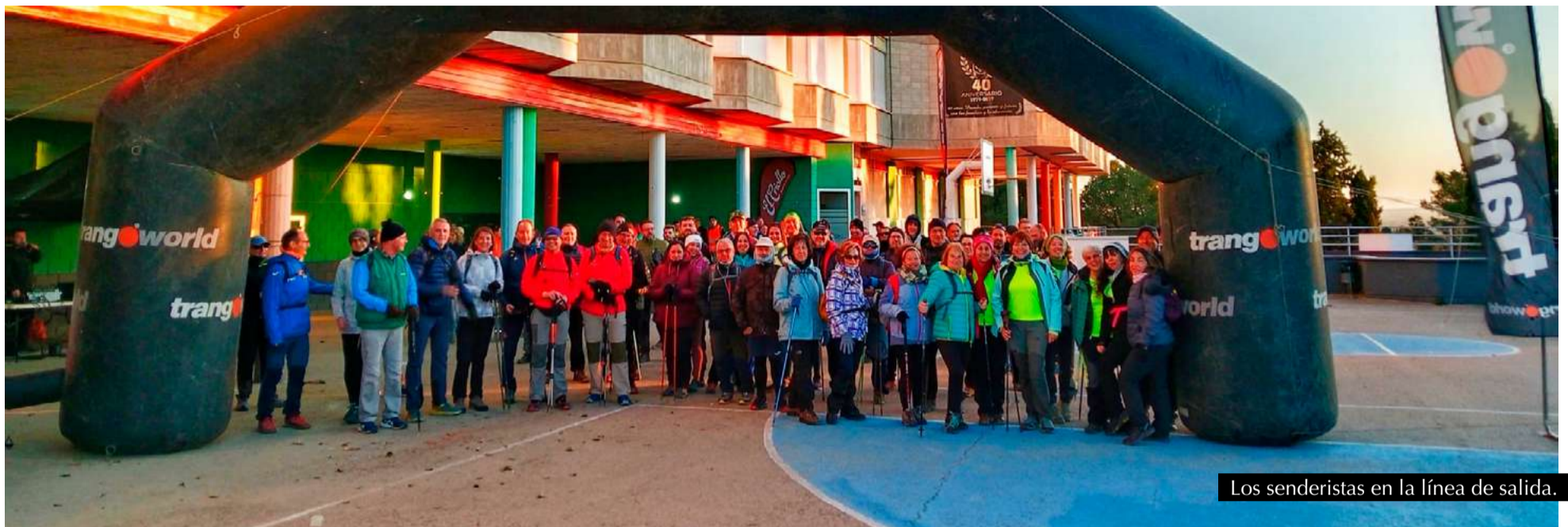
Los senderistas en la línea de salida.