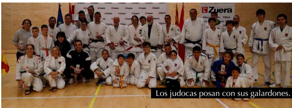
Los judocas posan con sus galardones.

Zaragoza y Colegio Corazonistas. Este torneo se ha consolidado como una cita imprescindible para el judo infantil, no solo por su impecable organización, sino por los valores que transmite a los más pequeños: respeto, esfuerzo, disciplina y compañerismo.