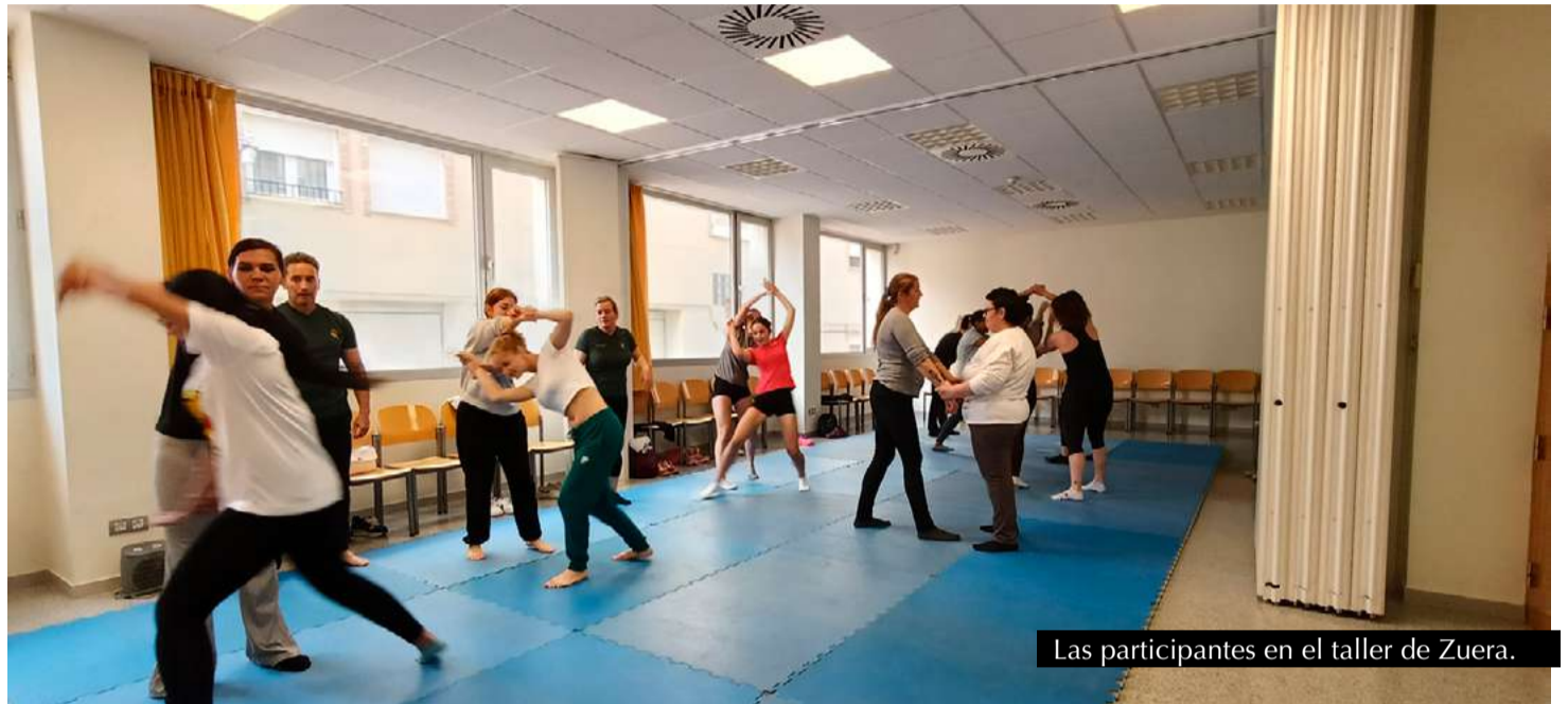
Las participantes en el taller de Zuera.

Con iniciativas como esta, las instituciones públicas refuerzan su compromiso en la lucha contra la violencia de género, promoviendo el empoderamiento y la protección activa de las mujeres en el territorio.