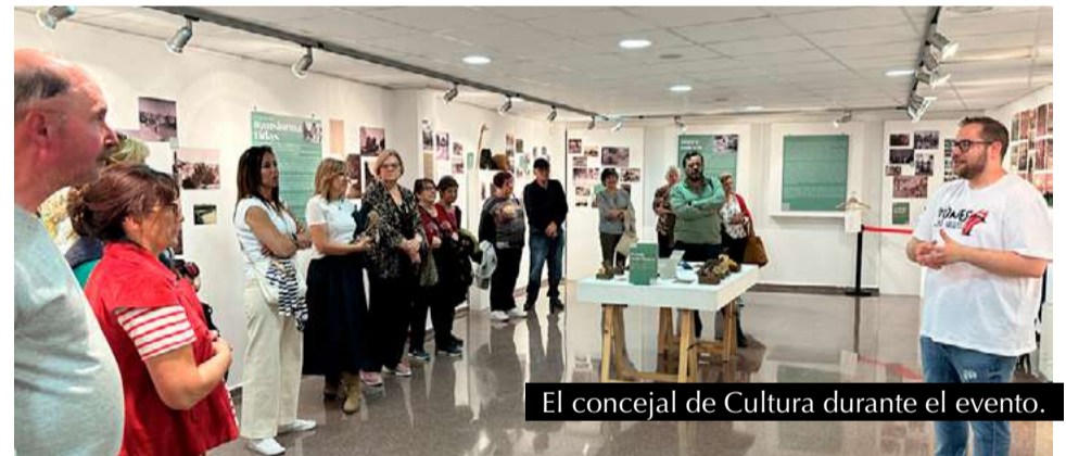
El concejal de Cultura durante el evento.

En una tarde llena de historia y reflexión, la concejalía de Cultura, junto con la Asociación Territorio Mudéjar, organizó un interesante paseo por el casco histórico de San Mateo de Gállego. Este evento formó parte del convenio firmado por ambas entidades para promover el patrimonio cultural y artístico del municipio. La actividad, que reunió a vecinos, expertos y visitantes, permitió sumergirse en el alma del pueblo a través de una charla vivencial sobre urbanismo, arquitectura, tradiciones y paisaje.