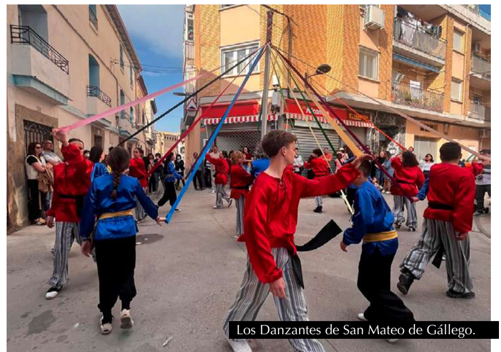
Los Danzantes de San Mateo de Gállego.