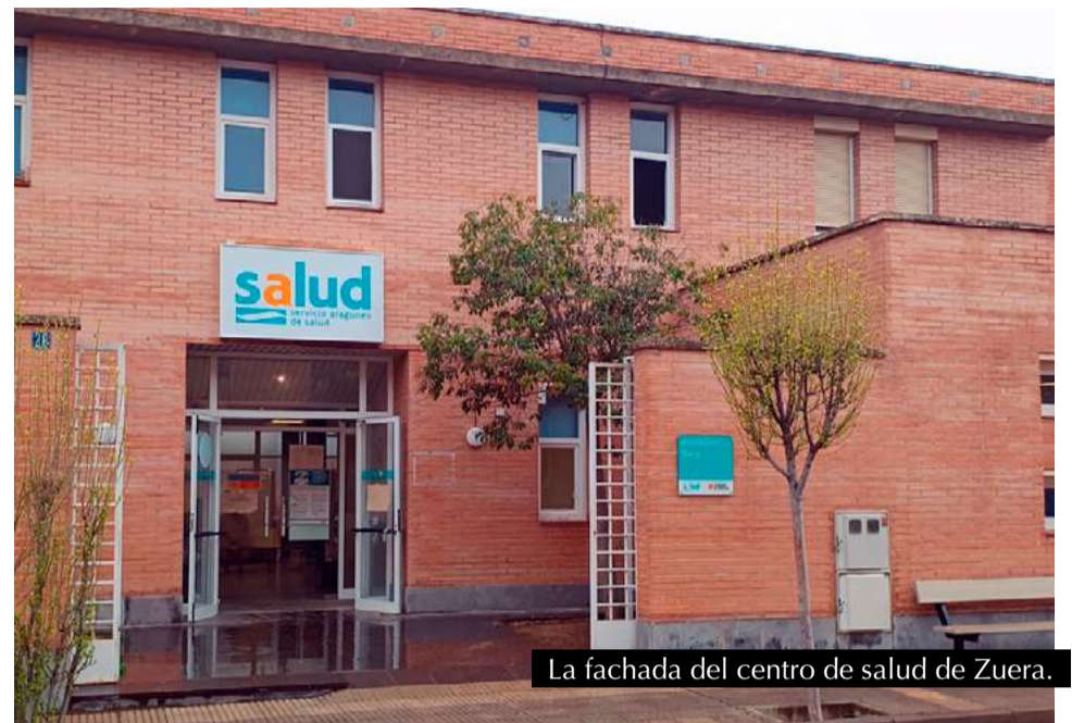
La fachada del centro de salud de Zuera.

1. Que el Gobierno de Aragón construya el nuevo centro de salud de Zuera en la ubicación prevista con