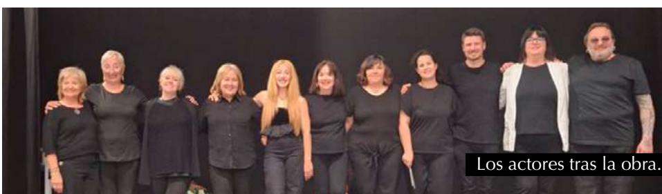
Los actores tras la obra.