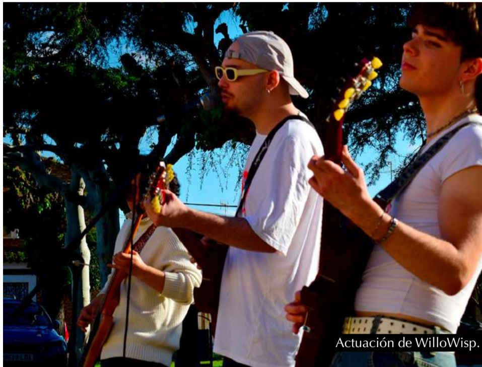
Actuación de WilloWisp.

Ontinar celebró el pasado 23 de abril su tradicional fiesta de San Jorge, reuniendo a vecinos y visitantes en una jornada llena de convivencia, diversión y música.