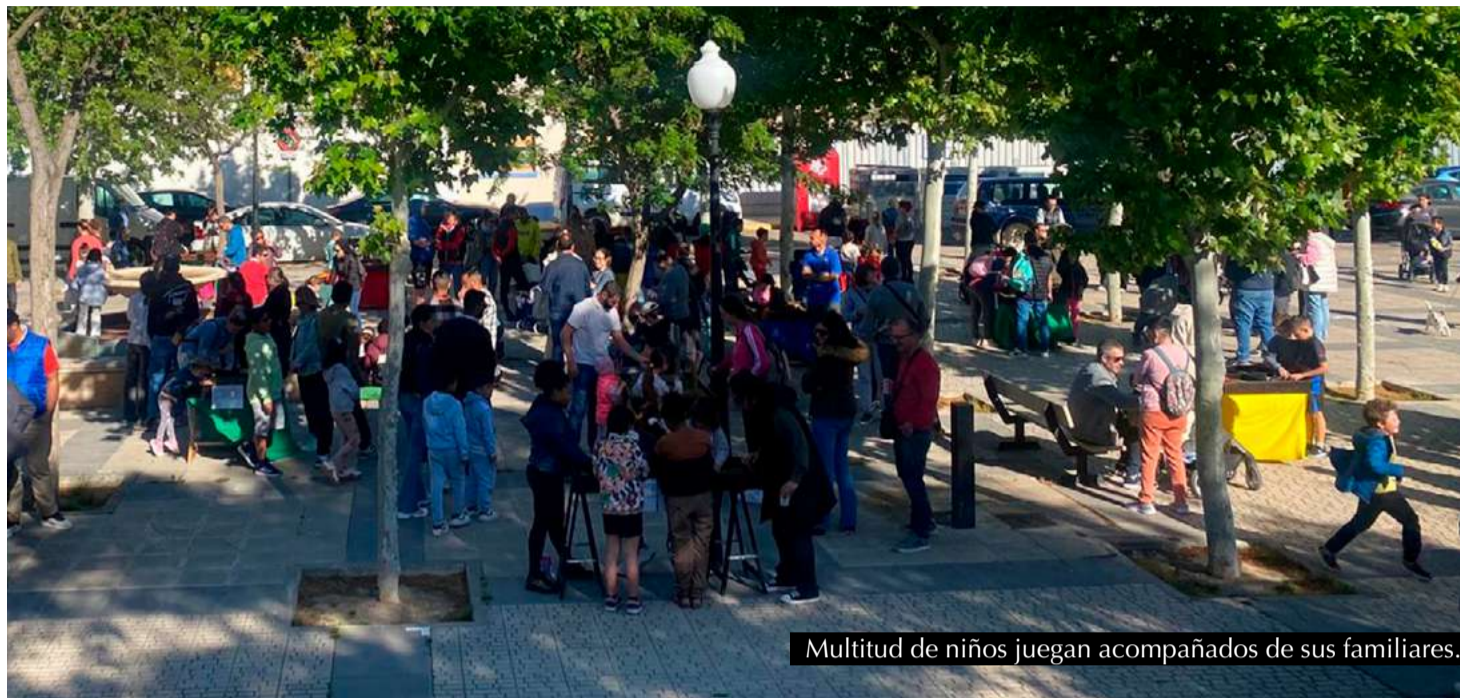
Multitud de niños juegan acompañados de sus familiares.

Durante varias horas, los/as participantes pudieron disfrutar de juegos tradicionales en formato gigante, fomentando la diversión al aire libre, la creatividad y la convivencia en un ambiente familiar y distendido. La iniciativa, organizada desde el área de infancia del Ayuntamiento de Zuera, atrajo a numerosas familias que se acercaron para compartir una tarde diferente.