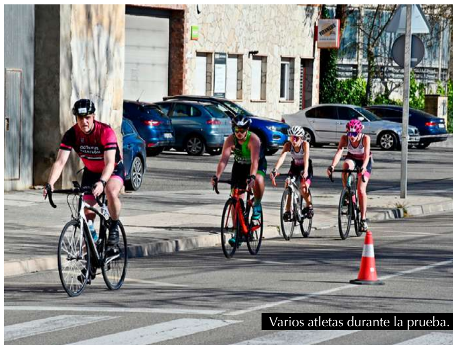
Varios atletas durante la prueba.

vel de competición y compañerismo entre los/as participantes. Especial agradecimiento a la organización, Protección Civil y Policía Local de Zuera por su labor, garantizando la seguridad de los participantes durante todo momento, así como a los/as participantes, voluntarios/as y público en general por su implicación y entusiasmo.