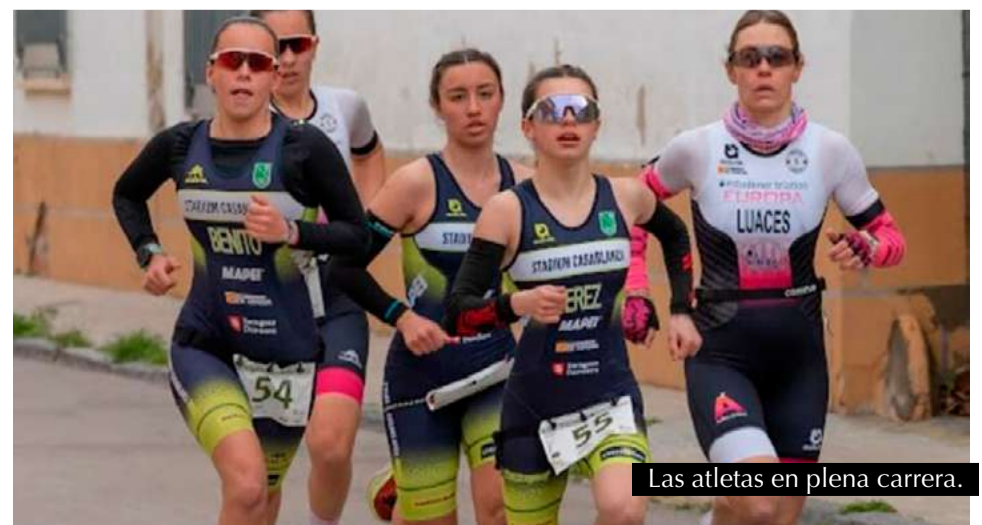
Las atletas en plena carrera.