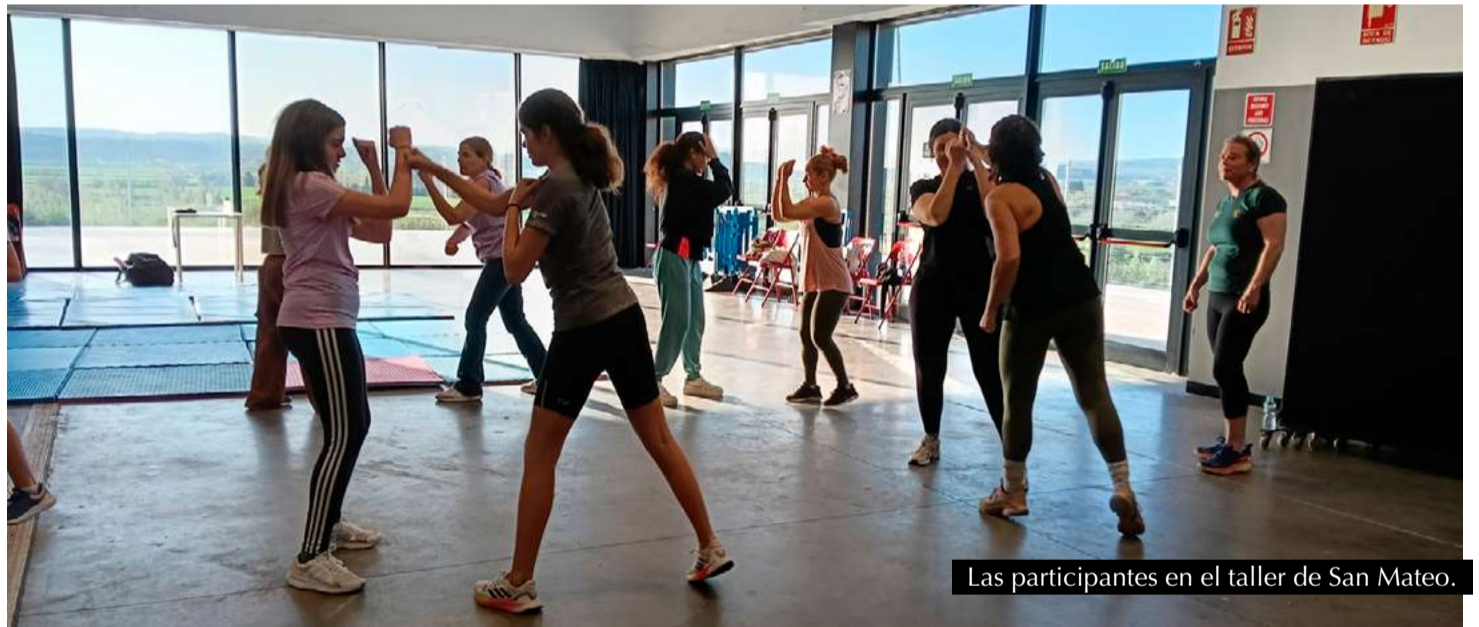
Las participantes en el taller de San Mateo.